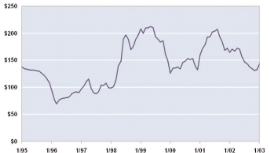
Figure 1 : Prix mensuel moyen des permis de SO 2 ($ par tonne de SO 2 )

Toutefois, nous soutenons que deux éléments soulèvent des questions susceptibles d'atténuer ce constat très positif. En premier lieu, le prix des permis a fortement fluctué depuis le lancement du programme. Sur la figure 1 8 , on observe par exemple que le prix est passé de 70 US$ en 1996 à près de 200 US$ en 1998. De telles fluctuations sont couramment observées sur les marchés de nombreux biens, particulièrement sur ceux des actifs financiers. Néanmoins, dans le cas des permis d'émission, on peut s'interroger sur l'impact de la volatilité de ce signal prix sur les décisions de réduction des émissions par les entreprises concernées. En particulier, l'incertitude sur le prix futur des permis (donc sur les recettes de futures ventes ou les coûts de futurs achats de permis) n'entraîne-t-elle pas un découragement des investissements dans les techniques de dépollution ? Ceci rendrait la politique de limitation des émissions plus coûteuse qu'elle ne le serait en présence d'un prix stable et/ou prévisible. Cette question, qui n'a pas encore trouvé de réponse convaincante, est par ailleurs de nature à alimenter le débat sur la comparaison entre les instruments "marché de permis" et "taxe". En effet, la taxe sur les émissions ne possède pas cet inconvénient parce que son taux est fixe, ou sujet à modifications susceptibles d'être annoncées à l'avance et dès lors anticipées par les agents concernés 9 .